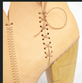
Chloé Stanyon Créatrice chaussure showtime.arts.ac.uk/chloestanyon

Pour l'édition de septembre 2012, LE CUIR A PARIS a sélectionné des talents qui souhaitent mettre leur expertise à votre service pour la réalisation de projets sur-mesure.