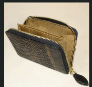
Aile de Corbeau Designer, prototypiste sellerie-marroquinerie www.aile-de-corbeau.com